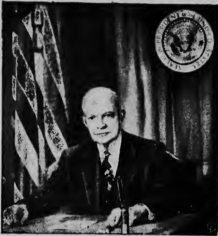
President Eisenhower zal zich waarschijnlijk kandidaat stellen voor de president-candidaatverkiezingen die in Juli van dit jaar worden gehouden.